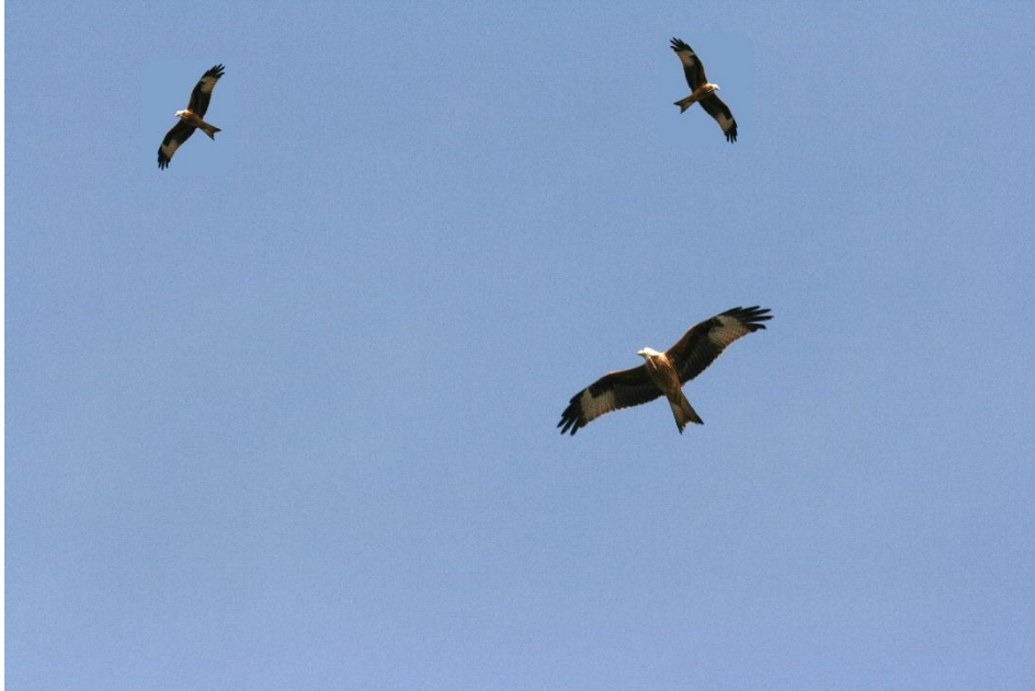
Røde glenter

Rød glente er trækfugl, men oftest er det kun ungfuglene der trækker syd på til f.eks. Frankrig og Spanien. I milde vintre vil de fleste af ynglefuglene overvintre i relativ nærhed af deres ynglested.