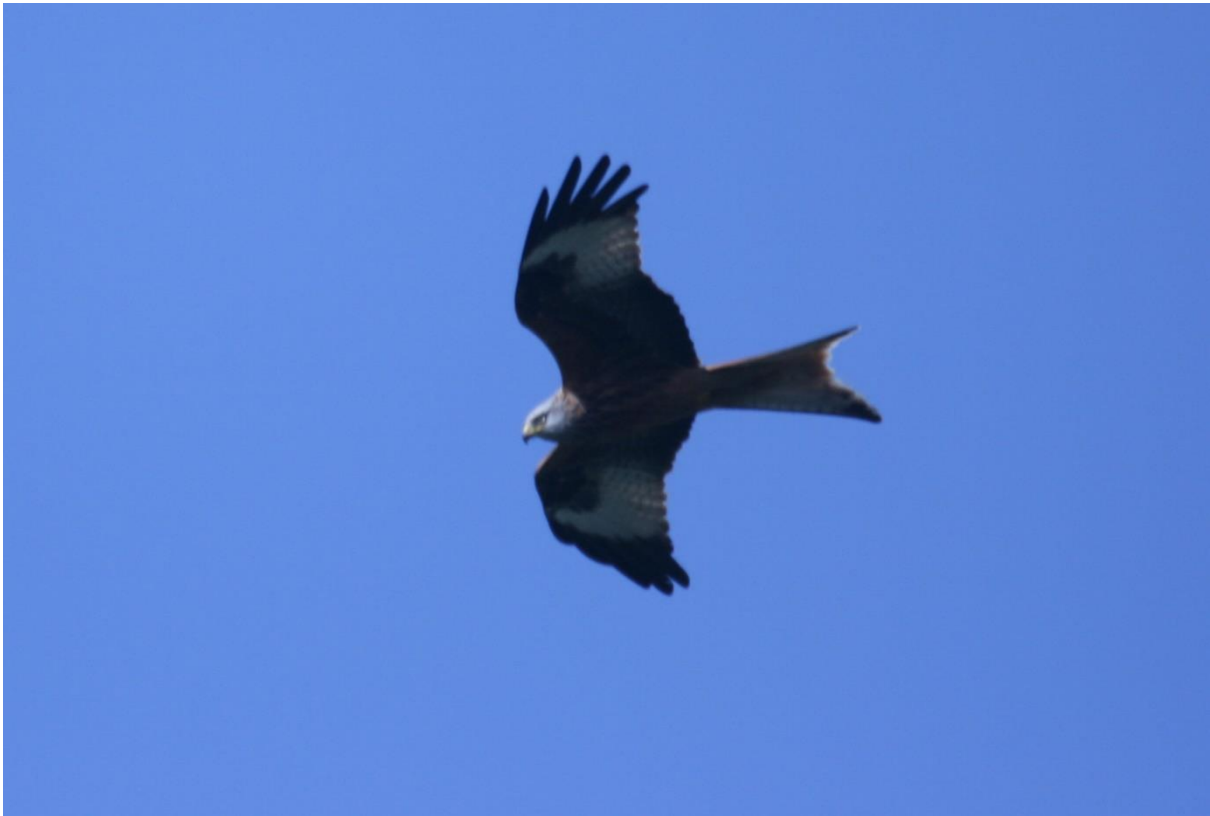
Rød glente

I de sidste ca. 10 vintre har man set Røde glenter på kollektive overnatningspladser i Danmark. Først i Sydjylland og senere ved Åmosen i Vestsjælland. De første år var det en 15 til 20 fugle, men i det sidste 2-3 vintre er det steget til 75-80 fugle eller mere flere steder i Danmark (Åmosen, Horsens og Djursland. Ynglebestanden er også steget i denne periode fra omkring 20-25 par til over 100 par i hele Danmark.