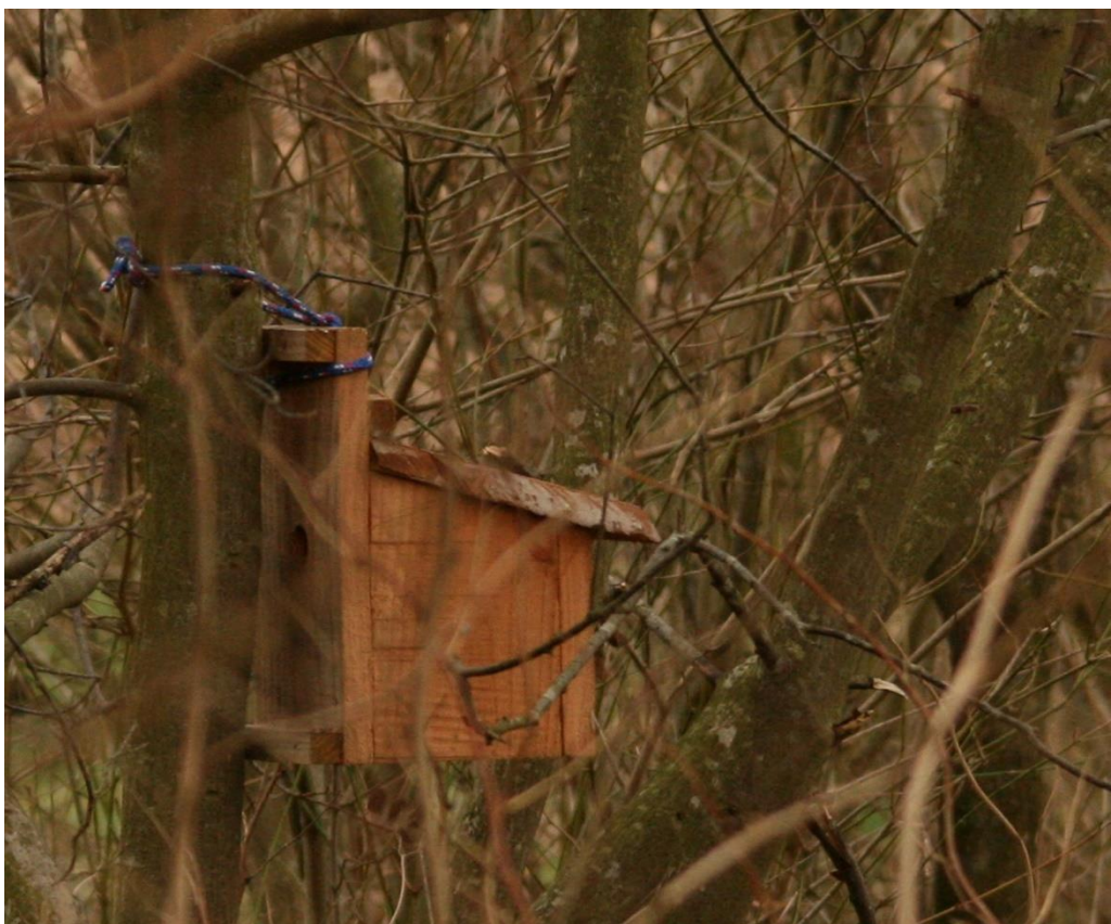
Ynglekasse til Hasselmus

Her ses en af ynglekasserne til Hasselmusen