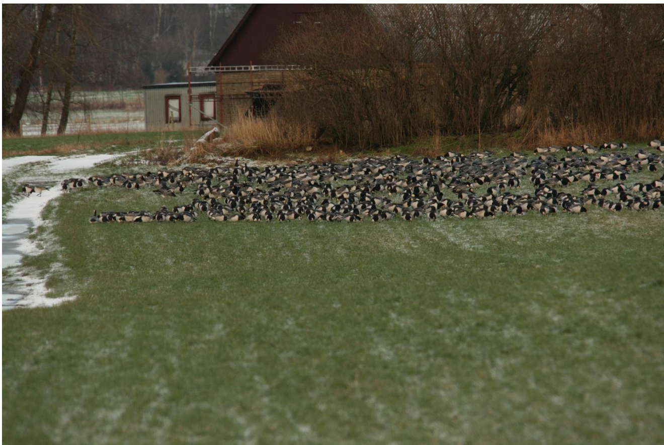
Del af Bramgåse-flok langs Susåen i Nåby-området

Blandt gæssene er der set en halsbåndmærket Grågås fra Norge og Sverige, en Blisgås mærket om vinteren i Holland i 2002 (nu mindst 15 år gammel), en Sædgås mærket i NØ-Finland, som var mere end 20 år gammel) og en anden Sædgås fra Finland, som dog kun er 2-3 år gammel samt en Sangsvane mærket i Letland (er nu set de sidste 3 vintre i naturparken).