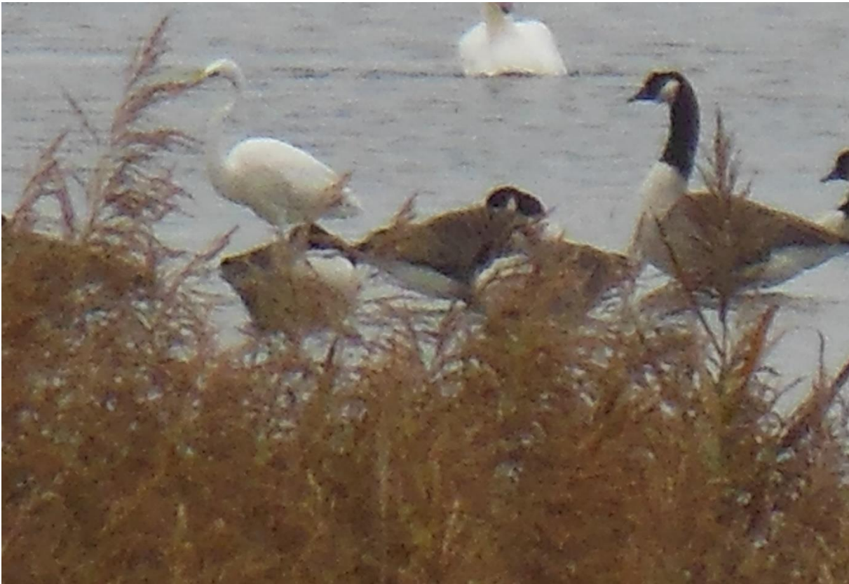
Sølvhejre ved Hammeren, Bavelse/Regstrup (Benth Micho Lange 2016)

Da Sølvhejre er fundet som ynglefugl første gang i Danmark i 2014, er der grund til at se efter Sølvhejrer i f.eks. mindre kolonier af Fiskehejrer. Da der er få ynglende Fiskehejrer i naturparkområdet – formodentlig kun i områder omkring Sorø og Tuel sø, vil det være et godt sted at se efter Sølvhejren – specielt hvis der normalt er Fiskehejrer i området.