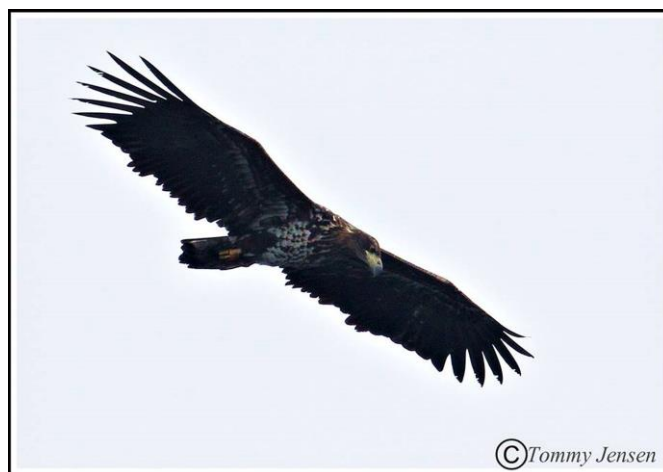
Havørn i Tystrup-Bavelse Naturpark

Der er ved Tystrup-Bavelse søerne set Havørne, der er blevet ringmærket i det svenske indland (Sydsverige), det baltiske Sverige (skærgårds-områder ved Østersøen), Lapland i Sverige, Lapland i Finland, sydlige Finland, Ålands-øerne, Polen, Tyskland og enkelte fra Danmark