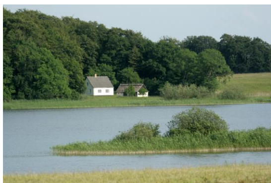
Udsigt fra Hørhaven – del af Tystrup-Bavelse Naturpark

Svalerne vender ofte tilbage til deres ynglesteder år efter år. Den ældste Landsvale, man kender til via ringmærkning, blev mindst 16 år.